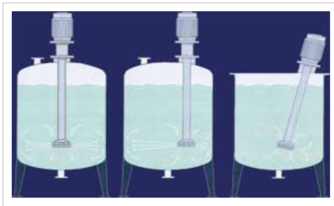
SM100系列高剪切均质乳化机多种安装方式